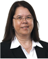
Mechthild Cloppenburg Fleischwirtschaft