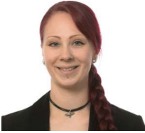
Lisa Buddrus Gartenbau